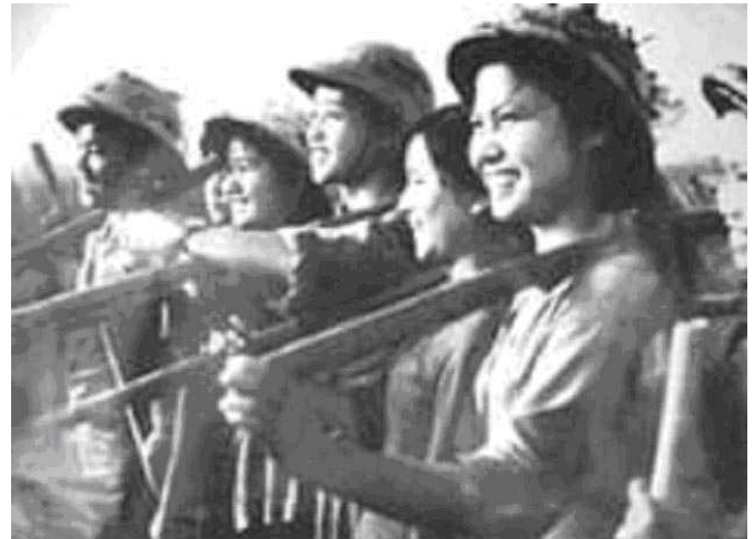
Thanh niên xung phong Hà Nội trong tuyến lửa miền Trung năm 1965

làm bè để vượt sông, lấp hố bom, phá bom nổ chậm, vận chuyển hàng quân nhu, khí tài và lương thực cho các chiến sĩ ngoài mặt trận 21 . Nói rõ ra, họ đảm bảo công tác hậu cần đặc biệt cho cuộc chiến tranh này.